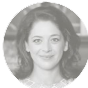
Catarina Portas A Vida Portuguesa